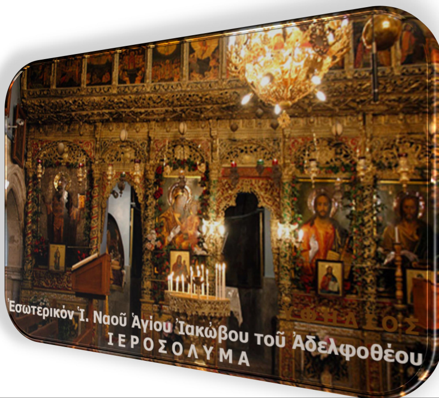
Εσωτερικόν Ἱ. Ναοῦ Ἁγίου Ἰακώβου τοῦ Ἀδελφοθέου ΙΕΡΟΣΟΛΥΜΑ